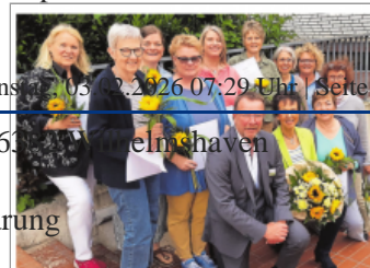
Neue Ehrenamtliche ausgebildet