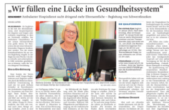
08.07.2024 Werbung neuer Kurs