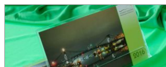
Postkartenkalender Wilhelmshaven 2016